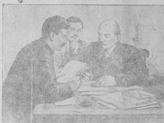
В. И. Ленин, И. В. Сталин и В. М. Молотов в редакции газеты «Правда» — 1917 г. Репродукция из альбома издательства «Искусство» — «Ленин и Сталин»

Большевистский привет армии работников печати в день 5-го мая! (Из журнала «Большевистская печать» № 8, 1941 г.)